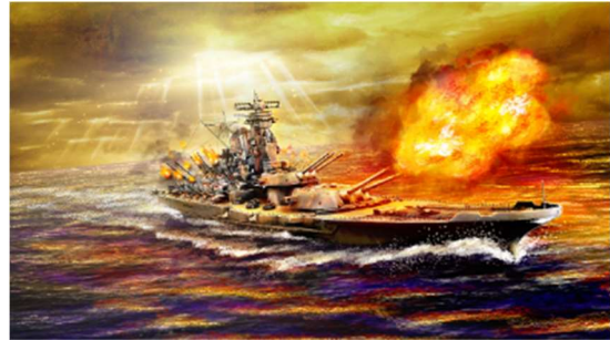
イメージイラスト