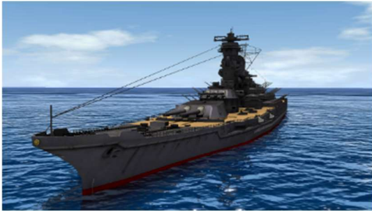
3D モデルスクリーンショット