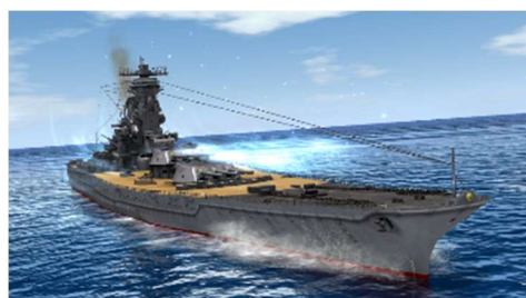
▲戦艦「大和(天一号作戦)-4周年記念型」

さらに、2021年8月31日（火）17:00～2022年8月31日（水）11:59の期間中、1日1回、無料で挑戦できる特別な10連サルベージが登場します。本サルベージは、最大30回（30日間分）まで挑戦できるほか、1、3、6、10、15、20、25、30回目は、★5艦艇の排出が確定となります。